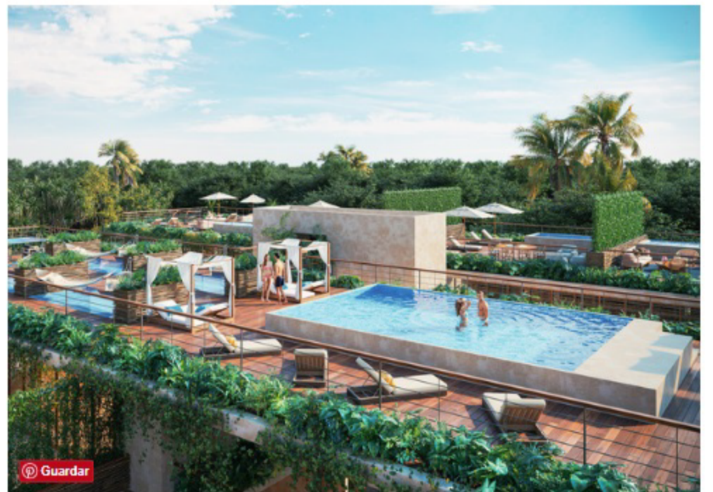
El rooftop fue diseñado como una gran área social.

La mejor casa con vista al Pacífico mexicano.