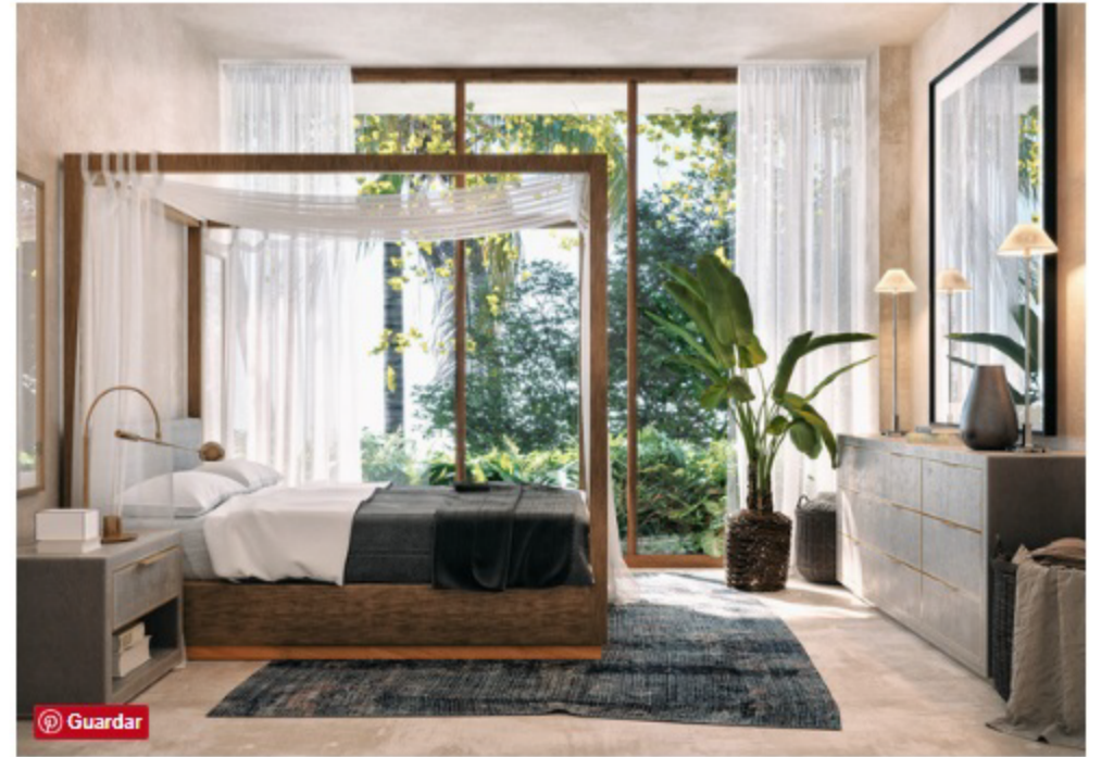
La luz solar fue una prioridad en el diseño.

Gitano Tulum , un restaurante-bar escondido en la jungla.