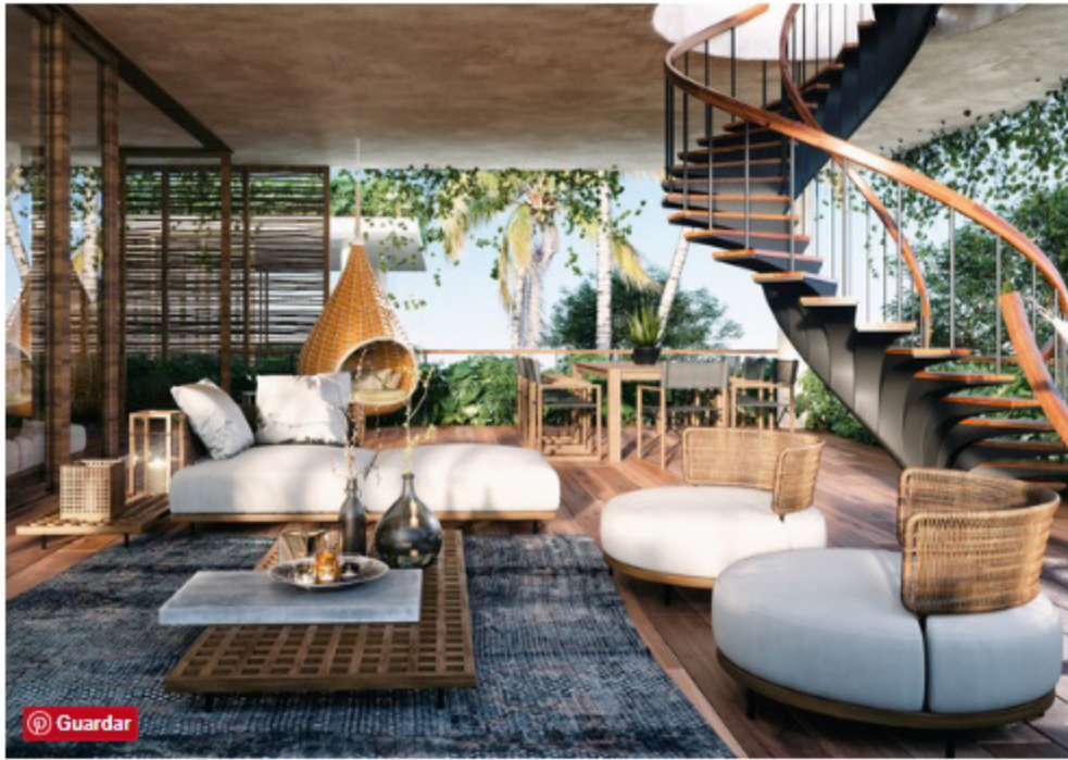
La vibra bohemia rige la decoración del lugar.