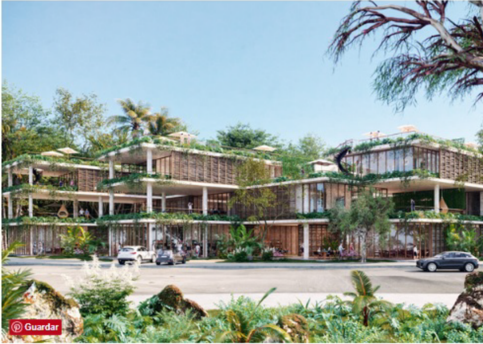
La estructura se integra con el panorama selvático de la zona.