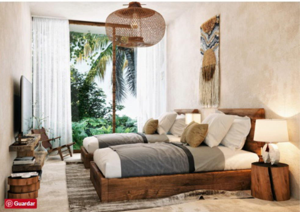
Los departamentos cuentan con dos o tres recámaras.

Llamado Amelia Luxury Residences fue diseñado por Sordo Madaleno Arquitectos . El lugar cuenta con 38 departamentos amplios y luminosos, que poseen una estética contemporánea con un toque caribeño. Los hogares de 90 o 175 metros cuadrados, tiene la opción de alojar 2 o 3 habitaciones, con una extensa sala-comedor y sala de baño.