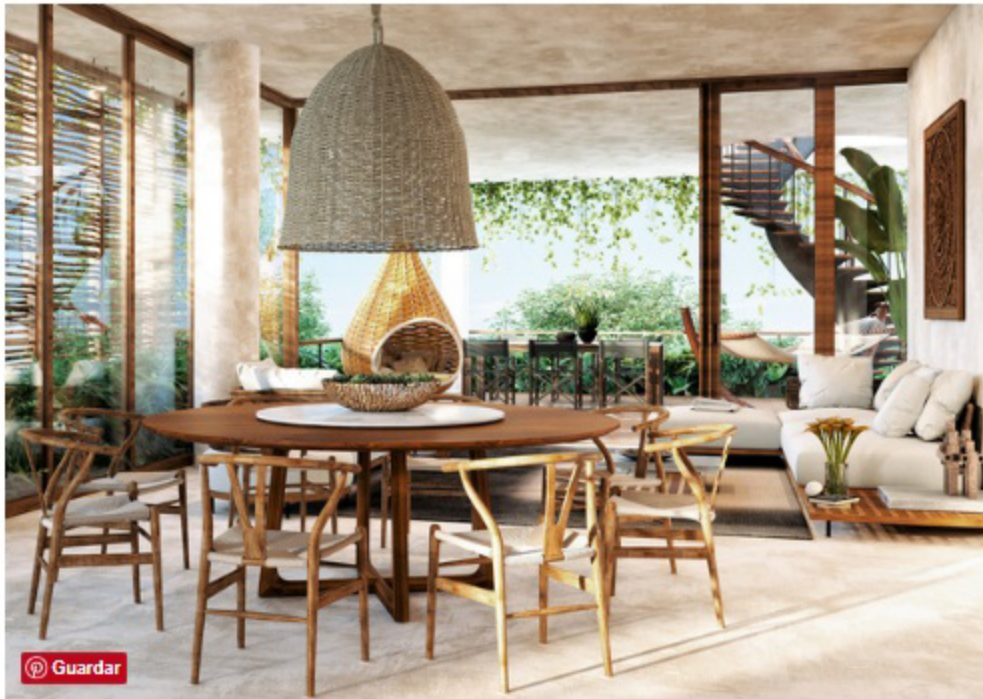
Los ambientes son amplios para que disfrutes de tu propio paraíso privado.