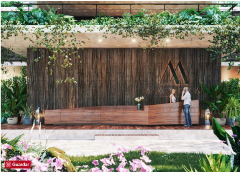
Los materiales naturales fueron un elemento básico para lograr ambientes relajados.